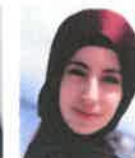
Hishab Tadi Supplier Feviqua soap