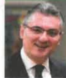
Ambassador Fadi Ziadé Ambassador Embassy of Lebanon to Canada